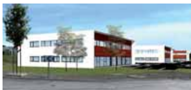
Cabinet FIDAL à La Roche Sur Yon

Grace à une implantation locale pérenne, au travers de 95 bureaux répartis sur toute la France, dont La Roche Sur Yon , nos clients bénéficient en sus d'une prestation de qualité, d'une relation récurrente et de proximité avec les Avocats du Cabinet FIDAL.