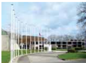
CCI de la Vendée