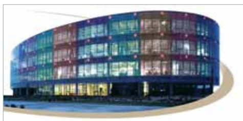
Siège de la Banque populaire