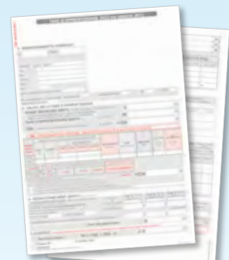
Bordereau ≥ à 250 salariés

En 2011, près de 13 000 entreprises des Pays de la Loire ont fait confiance à leur CCI pour traiter leur taxe d'apprentissage. Elles ont ainsi bénéficié d'un accompagnement personnalisé et d'une expertise avérée. La taxe d'apprentissage contribue à investir sur les hommes, leurs qualifications, la formation étant un des leviers majeurs de la compétitivité régionale.