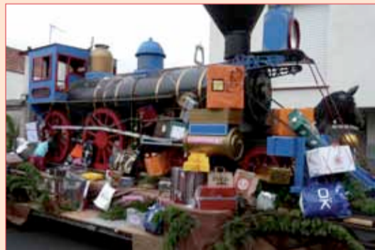
La parade de Noël

Cette association est soutenue par la CCI - Contact : Olivier Blouin - 02 51 45 32 34