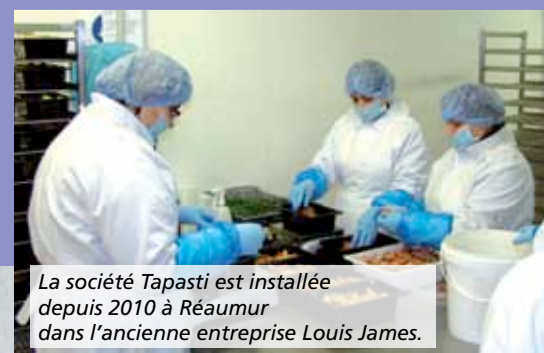
La société Tapasti est installée depuis 2010 à Réaumur dans l'ancienne entreprise Louis James .