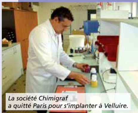
La société Chimigraf a quitté Paris pour s'implanter à Velluire.

Situés à proximité des axes routiers et autoroutiers du département, les Vendéopôles rassemblent 160 entreprises pour 6000 emplois. Pour les sociétés SFPI (Thermolaquage de Vendée) ou encore Seldén Mast , ces pôles bénéficient d'un environnement et d'équipements de qualité en offrant des perspectives d'évolution. « A compter du mois de juin, notre surface de production va passer de 3500 à plus de 8500 m 2 » rappelle Florent Ferchaux, directeur de Thermolaquage de Vendée . Chez Seldén , on se réjouit « des possibilités d'extension envisagées pour le développement de la société ».