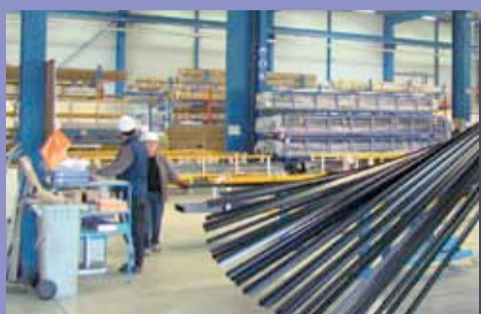
Le groupe SFPI est installé sur le Vendéopôle de Chavagnes-en-Paillers.

Aux antipodes d'une activité mono-industrielle, la Vendée s'illustre dans pléthore de secteurs d'activités. Le nautisme, l'agroalimentaire et les filières métallurgiques résonnent depuis longtemps sur le plan national et