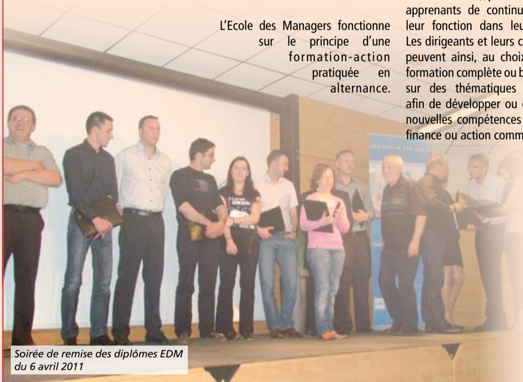
Soirée de remise des diplômes EDM du 6 avril 2011