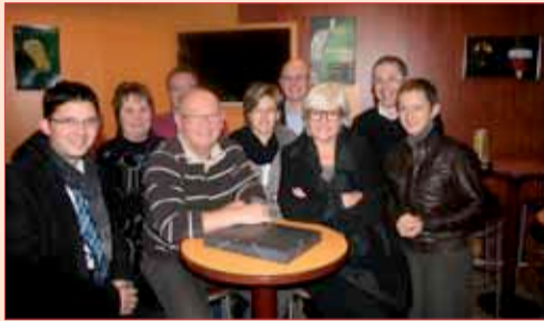
Le bureau d'Action Challans Commerce

Outre l'organisation d'une braderie dans le centre-ville (16 avril) et la participation à la fête de la musique ou encore le projet de mettre sur pied un vide-grenier, les membres actifs d'ACC planchent sur un projet conséquent. « En lien étroit avec la municipalité via le FISAC, nous étudions la possibilité d'avoir un manager de centre-ville. L'une