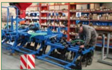
La récupération des eaux pluviales sur le nouveau bâtiment permet son utilisation dans les process peinture de la société.