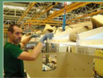
Tous les services de l'entreprise O'hara sont certifiés ISO 14001